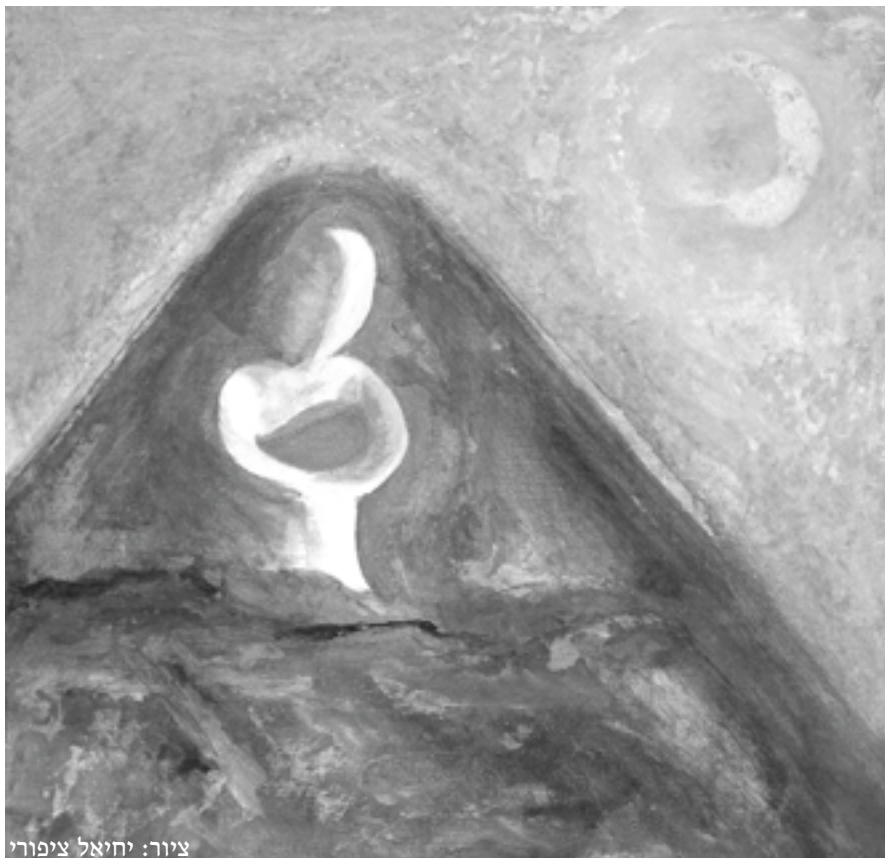
ציור: יחיאל ציפורי

שרה שדמי-וורטמן היא מנהלת אגף צעירים וראש תחום קהילה במרכז "שדמות" לפיתוח מנהיגות בקהילה במכללה האקדמית לחינוך אורנים